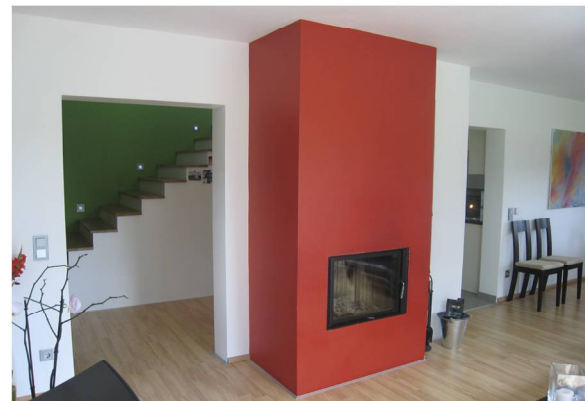
Foto: Wohnzimmer mit Kamin