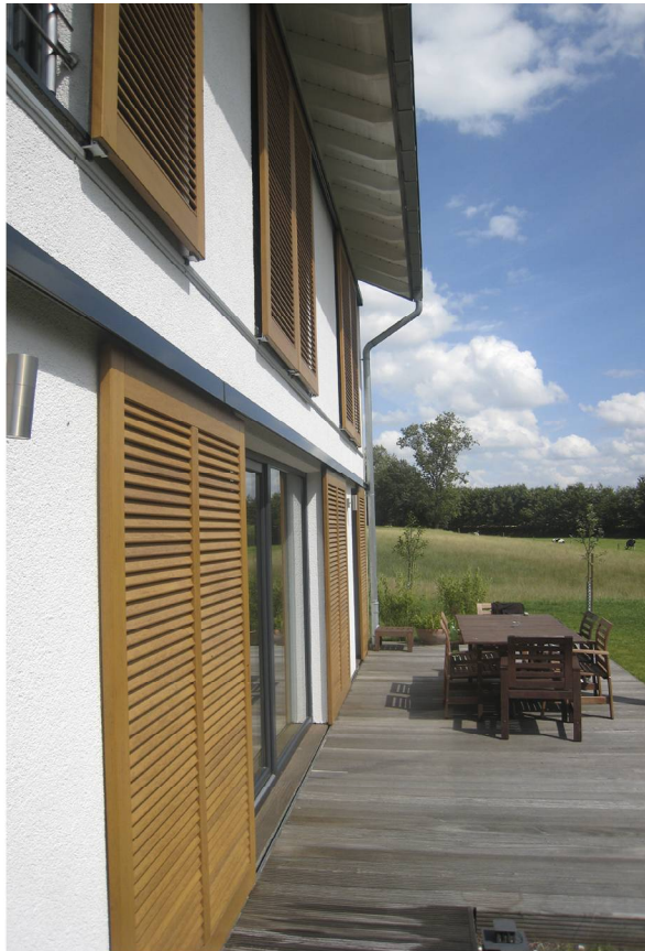
Foto: Fassadenelemente und Holzterrasse