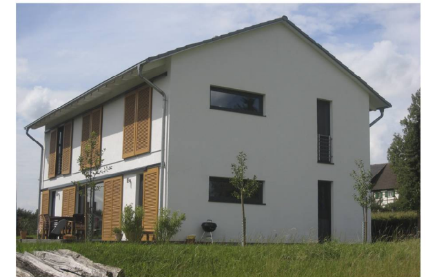
Foto: Gartenseite und Seitenansicht