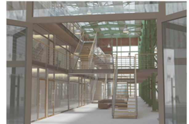
Visualisierung Innenraum vom Erdgeschoss