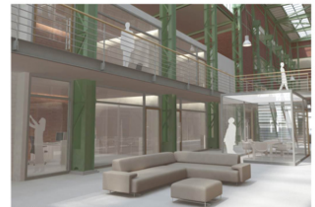
Visualisierung Innenraum vom Erdgeschoss