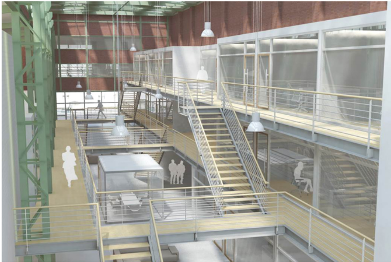
Visualisierung Innenraum vom 2. Obergeschoss