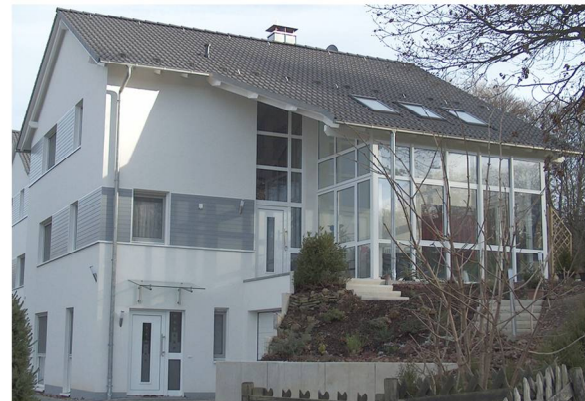
Foto: Eingang Haus 1 mit Einliegerwohnung im UG