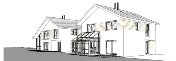
Perspektive: Garten [Süd-Ost]

Das eigentlich für eine Bebauung vorgesehene Grundstück im landschaftlich reizvoll gelegenen Hattingen-Bredenscheid wurde mit 2 Einfamilienhäusern ressourcenschonend bebaut. Bei dem Zweigenerationsensemble wurde die WDVS-Fassade mit versetzt umlaufender Fassadenbänderung aus grau lasierter Holzverschalung optisch aufgewertet. Die Niedrigenergiehäuser verfügen neben moderner Haustechnik über offene Kamine, Wintergärten und flexible Grundrissstrukturen.