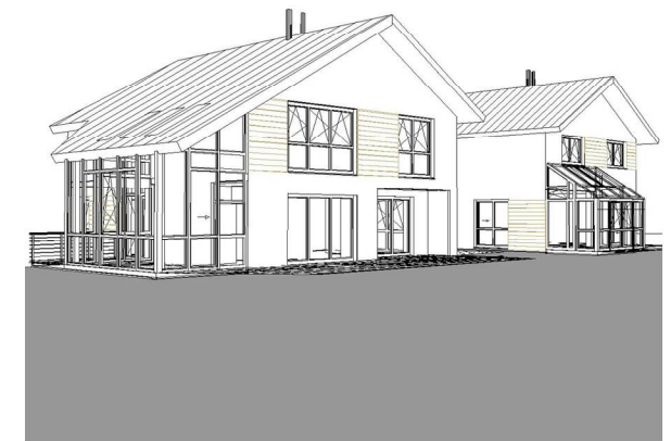
Perspektive: Garten [Süd-West]