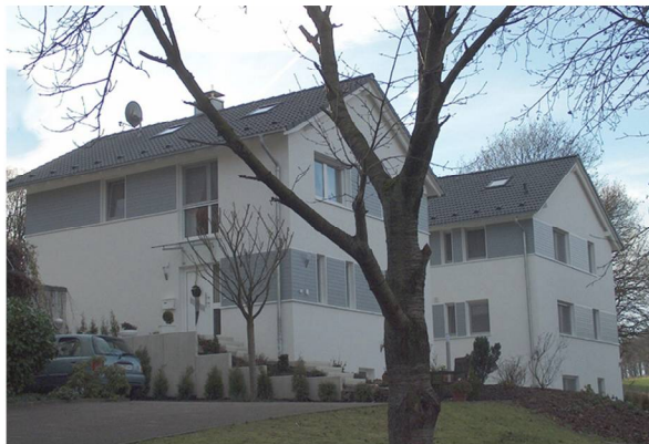
Foto: Eingang Haus 2