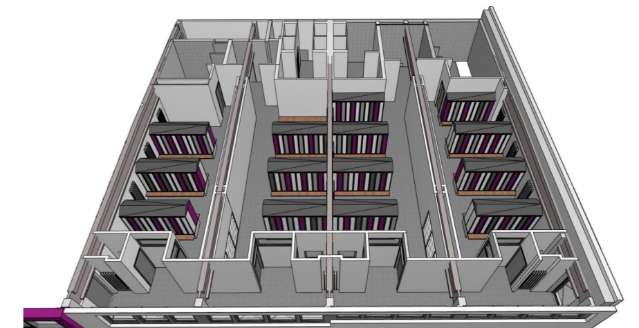
3D Grundriss Umkleibereiche